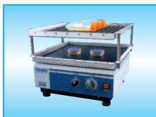
Seconda Piattaforma TY300 300x300 mm