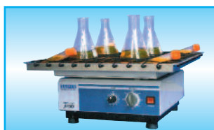
Piattaforma superiore UP400 400x400 mm