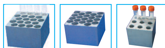
AB90-16.5 AB90-18 AB90-C15