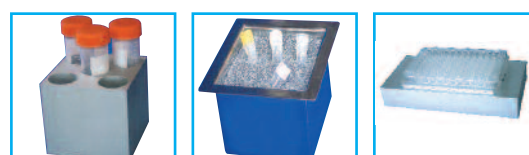
AB90-C50 GB-90 AB128-MPL