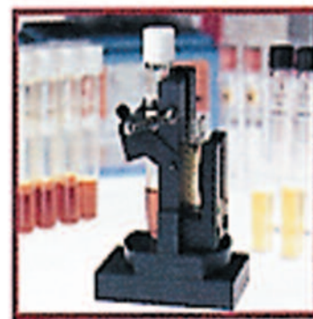
Supporto per portaprovette portacuvette Cod. 9423 UV6 1230E