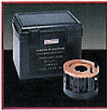
CVC (corredo di convalida calibrazione) Cod. 9423 UV6 1460E