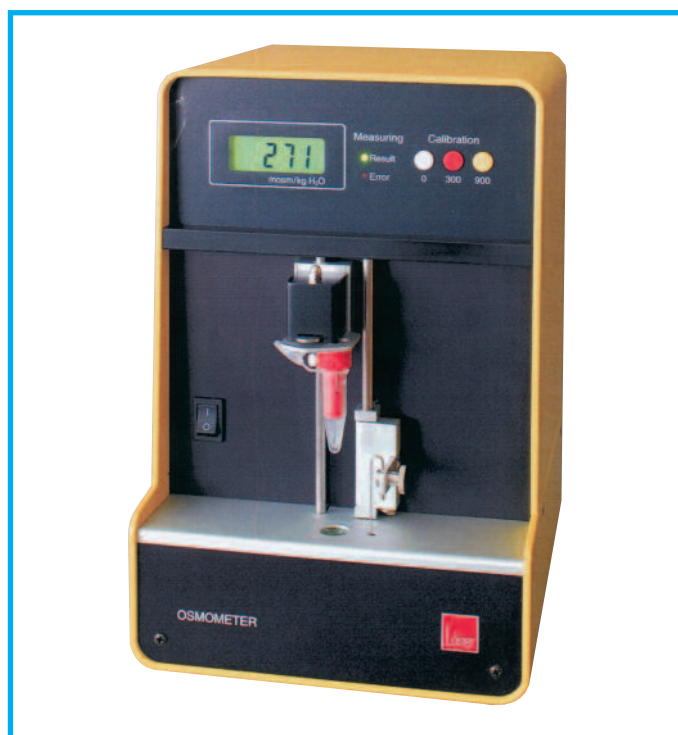
Micro-osmometro manuale Modello 6

Sia il modello 15 sia il modello 6 consentono la calibrazione su tre punti: 0, 300 e 900 mOsm/KgH 2 O.