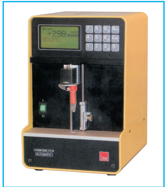
Micro-osmometro automatico Modello 15

Nel modello 15 automatico l'utente è guidato nell'utilizzo dell'apparecchio mediante un menu multilingue (compreso l'italiano) visualizzato sull'ampio display LCD. Al raggiungimento della temperatura di sovraraffreddamento, un servomeccanismo introduce automaticamente l'ago nel campione ottenendone il congelamento immediato. Al termine del processo di misura, il display mostra il risultato in mOsm/KgH 2 O grazie alla relazione lineare fra osmolalità e abbassamento crioscopico, oppure in termini di abbassamento crioscopico. Possono essere memorizzati fino a 100 risultati, ciascuno associato al proprio numero identificativo, alla data ed all'ora della misura effettuata. Il modello 15 automatico è provvisto inoltre di tre uscite seriali RS232, che consentono il collegamento a un PC esterno, a una stampante esterna dedicata e a uno scanner con codice a barre.